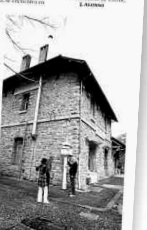
Estación de Sarrevoire, con un campo eléctrico.

Compromiso | Las dos coordinadoras por la reapertura del Cantabrico de ambos lados del Pirineo exigen un compromiso real para dejar atrás la política de "parochias". Reciben que los estudios certificar su rentabilidad, pese a que la línea está "muy lejos" de Madrid y París.