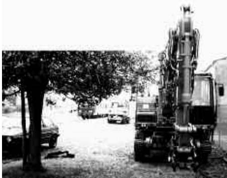
Engins rail-route prêts à travailler, attendant sous la pluie en gare d'Oloron