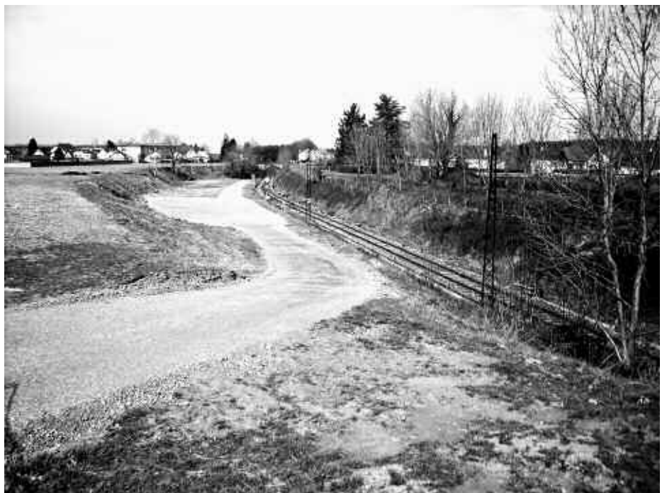
Plateforme de transbordement et d'accès rail-route à la sortie d'Oloron