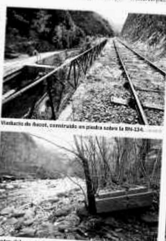
Restos del puente de l'Estanguet repositos parte de él.