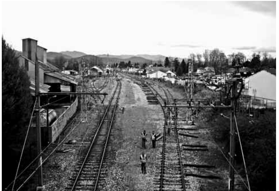
Opérations de renforcement de la voie 4 en gare d'Oloron

• Installation d'une demi-douzaine de bungalows de chantier en gare de Buzy-en-Béarn, où le relief du débord a été arasé pour permettre les évolutions des engins routiers.